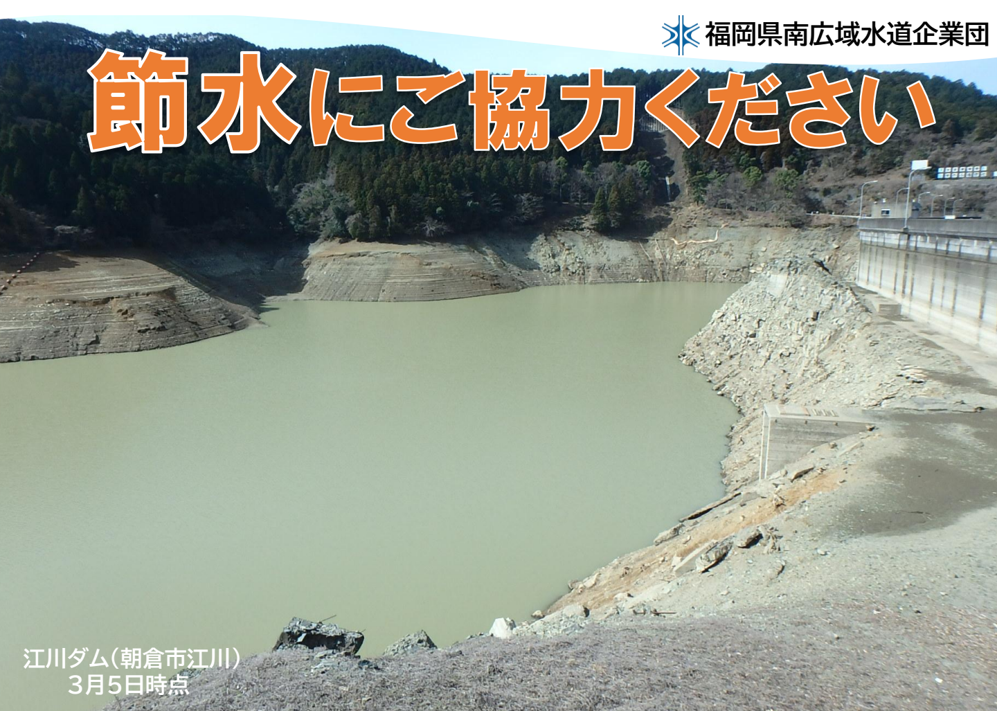
江川ダム(朝倉市江川) 3月5日時点

福岡県南地域の水道水の主な水源である筑後川は、昨年9月以降の少雨によって渇水状況が長期化・深刻化し、 筑後川上流ダム群の貯水量は残り僅か になっております。