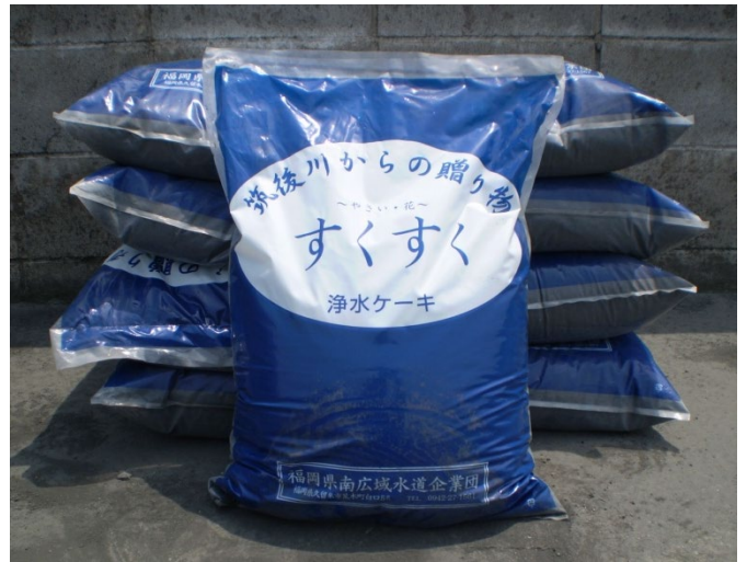
浄水ケーキ「すくすく」 (約20L/袋)