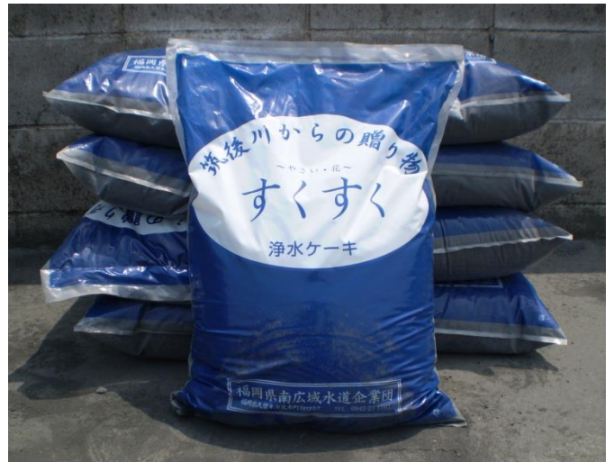
浄水ケーキ「すくすく」 (約20L/袋)