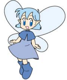
企業団のイメージキャラクターのまーちゃんです。よろしくお願ひします。

日頃から、企業団の水質管理業務にご協力いただき有難うございます。また、本年4月に構成団体と企業団とは「共同水質検査協定」を締結いたしました。これまで以上に連携を強化し、水源～給水栓までの一元的な水質検査を協力して行うことで、両者の水質管理の向上を図ることができると考えております。